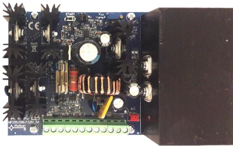
PWS-12-50 Tápegység kártya